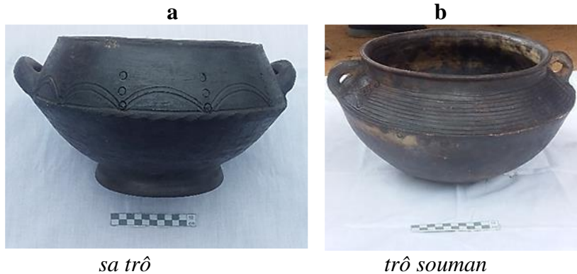
Planche photos n°3 : Les récipients fermés de forme ellipsoïde