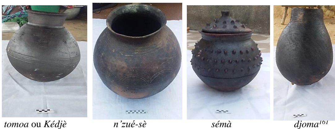
Planche photo n°4 : récipients fermés de forme sphérique

Sources : Photographie de terrain Yapi Apo Sandrine, Août 2022